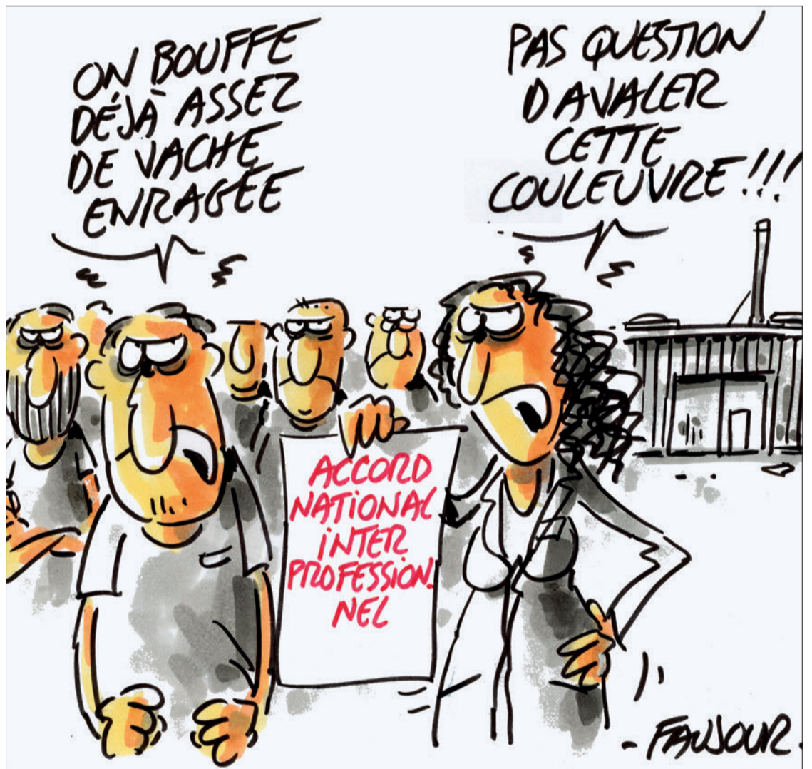
Bernard Thibault, secrétaire général de la CGT

Le 11 janvier 2013, les négociations nationales dites de « sécurisation de l'emploi » se sont terminées par un accord d'une extrême gravité pour les droits des salariés. La CGT et FO ont annoncé qu'elles ne le signeront pas. Par contre, la CFDT, la CGC et la CFTC ont décidé de le parapher. Un projet de loi doit être présenté au Conseil des ministres début mars, pour ensuite être voté au Parlement en mai.